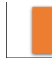
1/2 page hauteur PP : 105L x 255H