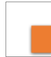
1/4 page PP : 90L*125H